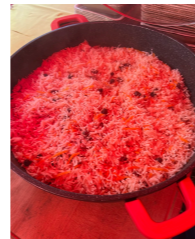
Afghanisches Qabuli Reisgericht - hier in vegetarischer Form ohne Gosfand bei den Wagenburg Kulturtagen 2025